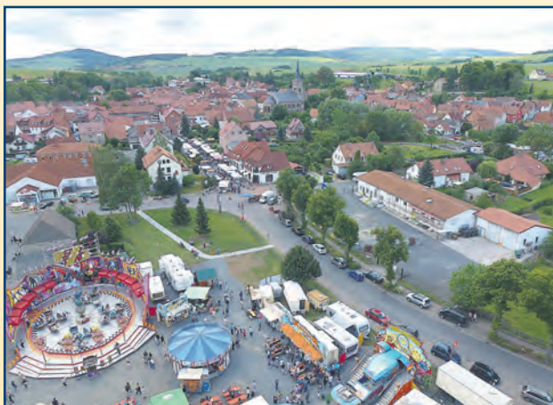
Ulrich Schramm Bürgermeister