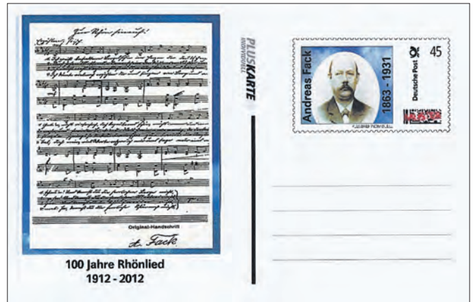
Pluskarte zum Thema 100 Jahre Rhönlied