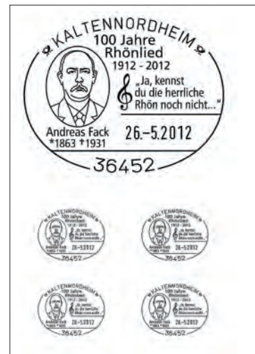
Sonderstempel Andreas Fack