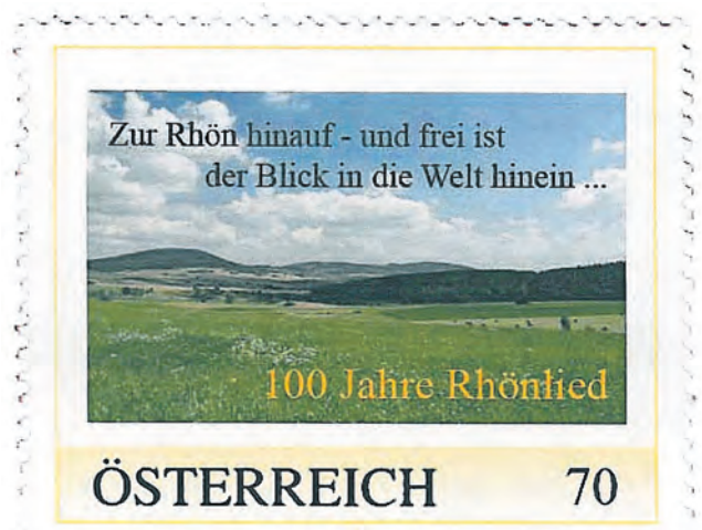
Marke 100 Jahre Rhönlied