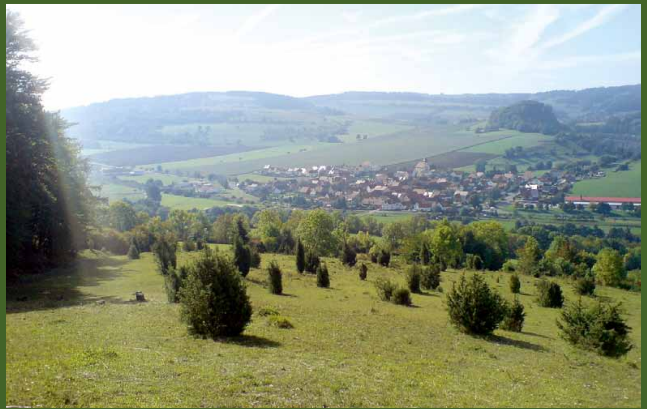
Blick auf Diedorf

Der Rundweg beginnt Nahe der Bushaltestelle in Diedorf und führt entlang der Sportplatzstraße sowie der Feldabrücke zunächst zur Teichanlage „Am Mühlrain“. Hier lädt das angrenzende Soayschaf- und Hirschgehege alle Tierfreunde unter den Wanderern zum Verweilen ein. Parallel zum „Dirleser Wasser“ führt der Weg gemächlich durch das „Lange Tal“. Nach kurzem Aufstieg zur Maas ist auch schon der „Gänseborn“ in Sicht: eine ideale Aufenthaltsmöglichkeit für Kurzstreckenwanderer und Familien. Neben einem kleinen Teich sowie einer Wasserquelle findet sich eine idyllische Schutzhütte mit Rastplatz unter einer alten Buche. Nun führt der Rundweg etwa 200 m zurück zum Waldrand und an einem Feuchtbiotop vorbei. Auf 470 m ü. NN bietet sich ein herrlicher Ausblick ins Feldatal. Am Waldrand des 527 m hohen Berg „Kuhkopf“ geht es zurück ins Tal Richtung Diedorf. Nahe des Ortsrandes verläuft der Rundweg auf einer gut erhaltenen Sandsteinbrücke über die Felda und an einer alten Feldascheune vorbei.